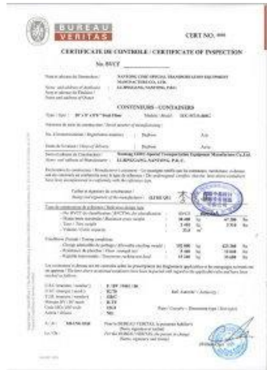
Tørrluft tilkobling og sertifikater kan inngå i leveransene