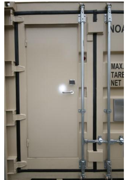
Verkstedcontainer forslag utvendig layout