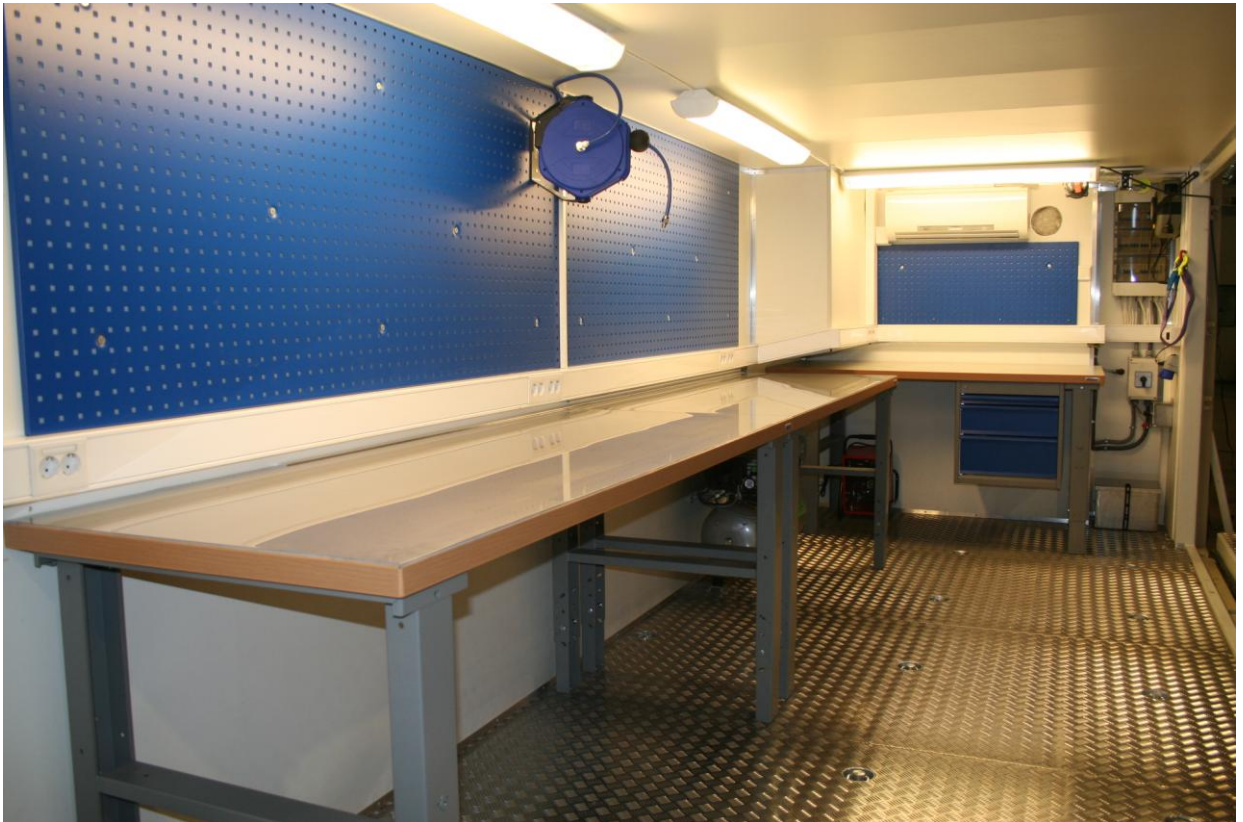
Verkstedcontainer forslag innvendig layout