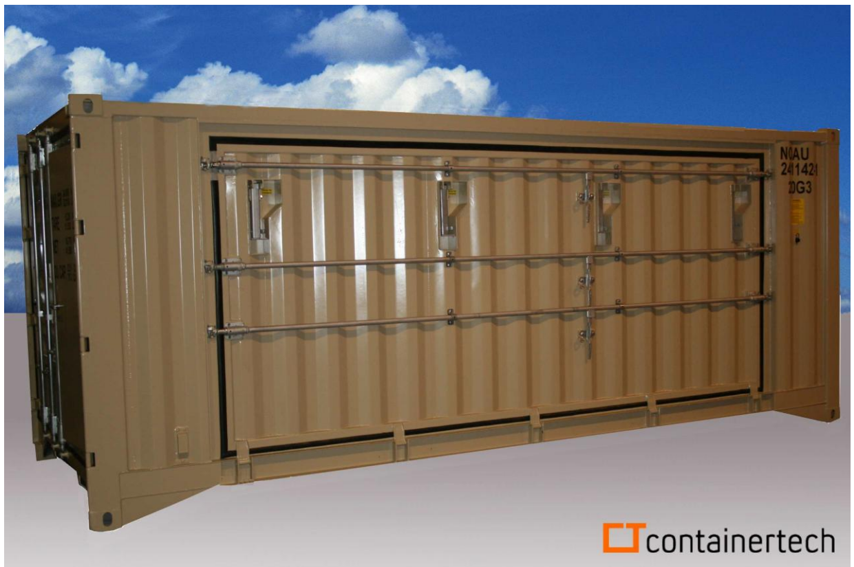
Verkstedcontainer med evt nedfellbar plattform hel side

Utvendig elektrisk tilkopledd 230V/32A og 400V/16A med deksel som beskytter mot regn og smuss. Innvendig montert fordelingstavle med styring og bryter